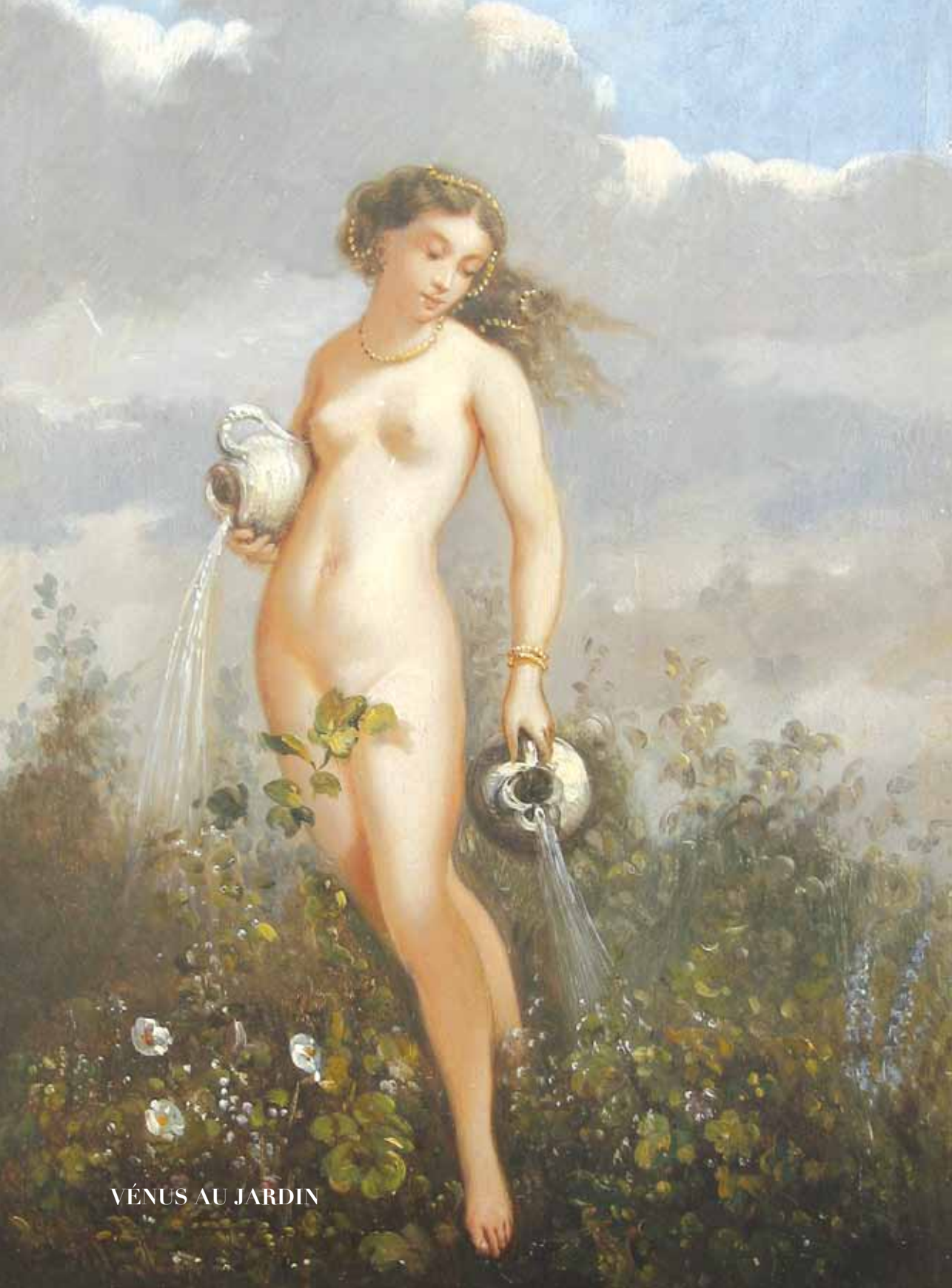
VÉNUS AU JARDIN

Cet ouvrage est aussi un hommage aux équipes du Domaine qui exercent leur art, avec talent et passion.